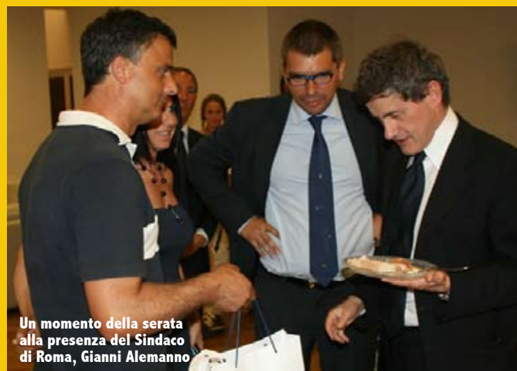
Un momento della serata alla presenza del Sindaco di Roma, Gianni Alemanno